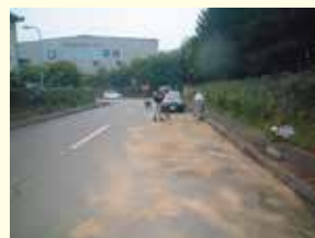
オイルを吸着したオイルゲーターを回収している状況。