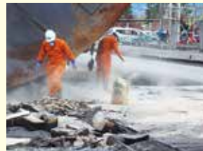
重油の流出処理にも有効