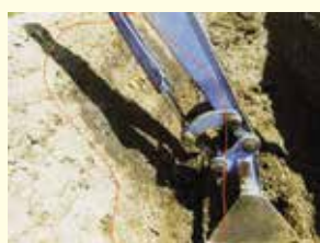
バックホーの作動油のホースが破裂して、内法面上に漏れた状況。