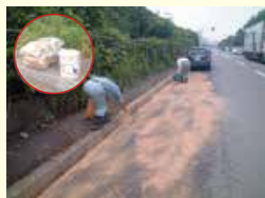
飛散したオイルにオイルゲーターを散布し、オイルを吸着させている状況。