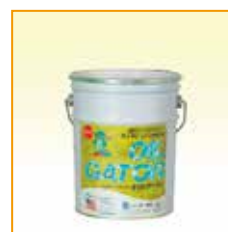
3kg入りペール缶 定価8,000円(税別)