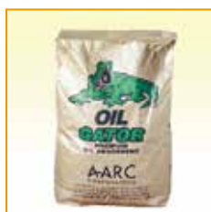
12kg入り原袋 定価18,000円(税別)