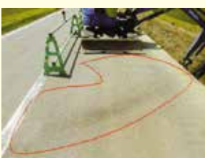
バックホーの作動油のホースが破裂して、舗装の上に漏れている。