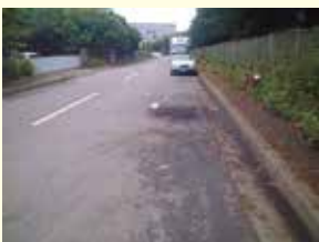
違法駐車車両からの油漏れ。舗装面にオイルが飛散している状況。