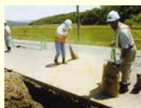
舗装に漏れた作動油に現場で備蓄していたオイルゲーターを撒き、油吸着させている状況。