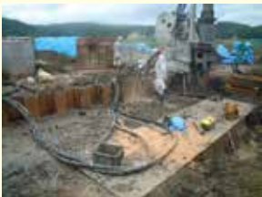
特殊油圧機械の油圧ホース破損により作動油流出