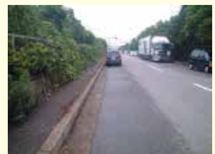
回収処理後の状況。雨が降っても油膜は発生せず。