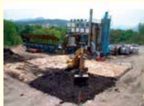
油が含まれた土壌の改良