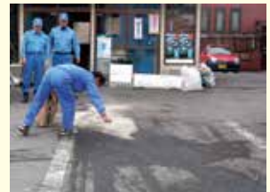
舗装面へこぼれた油の除去