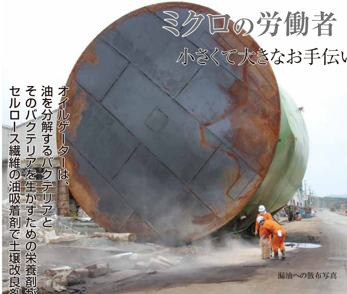
漏油への散布写真

オイルゲーターは、油を分解するバクテリアとそのバクテリアを生かすための栄養剤が入ったセルロース繊維の油吸着剤で土壌改良剤に最適です。