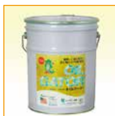
6kg入りペール缶 定価12,000円(税別)