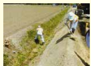
土水路の中に作動油がこぼれたのでオイルゲーターを使用し、早期処理を行い、油分の流出を防いだ。 (作動油7リットル程度にオイルゲーターを4kg程度撒き処理)